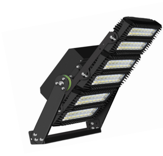
650W STAR Sport