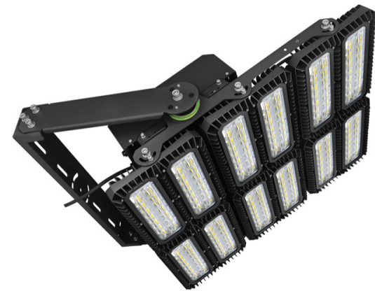
1.350W STAR Sport