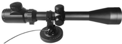
Präzisionszielgerät Precision aiming device