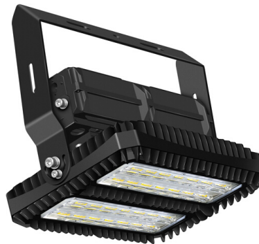
230W STAR Sport