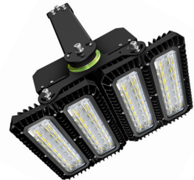
450W STAR Sport