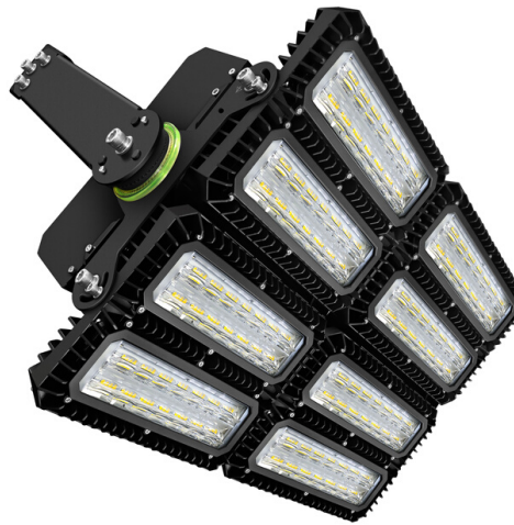
900W STAR Sport